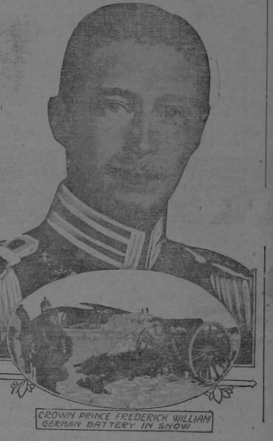
CROWN PRINCE FREDERICK WILLIAM GERMAN BATTERY IN SNOW

Fué culpa de el "mostaza" de su hijo Así llamó un Gral. alemán al Kronprinz