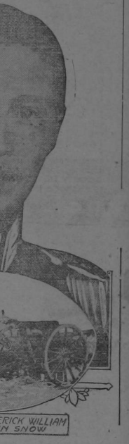
CROWN PRINCE FREDERICK WILLIAM GERMAN BATTERY IN SNOW

Fué culpa de el "mostaza" de su hijo Así llamó un Gral. alemán al Kronprinz