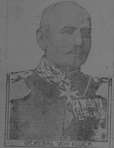
GENERAL VON KLUCK

El General Von Kluck, uno de los grandes sostens del ejército del Kaiser